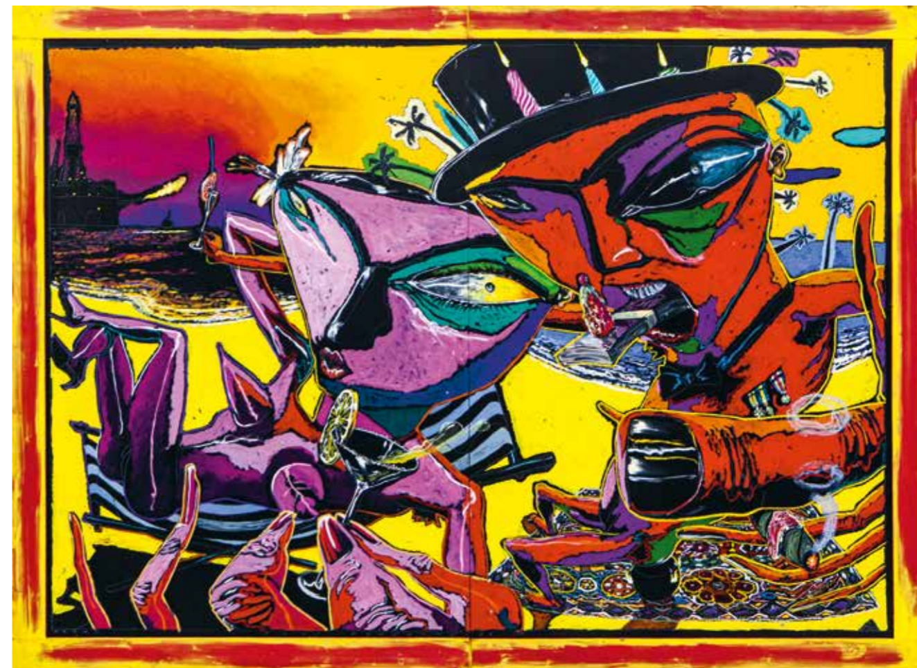
NOVÍ PENĚZOMĚNCI, 2011, kombinovaná technika na dřevě, 228x370cm