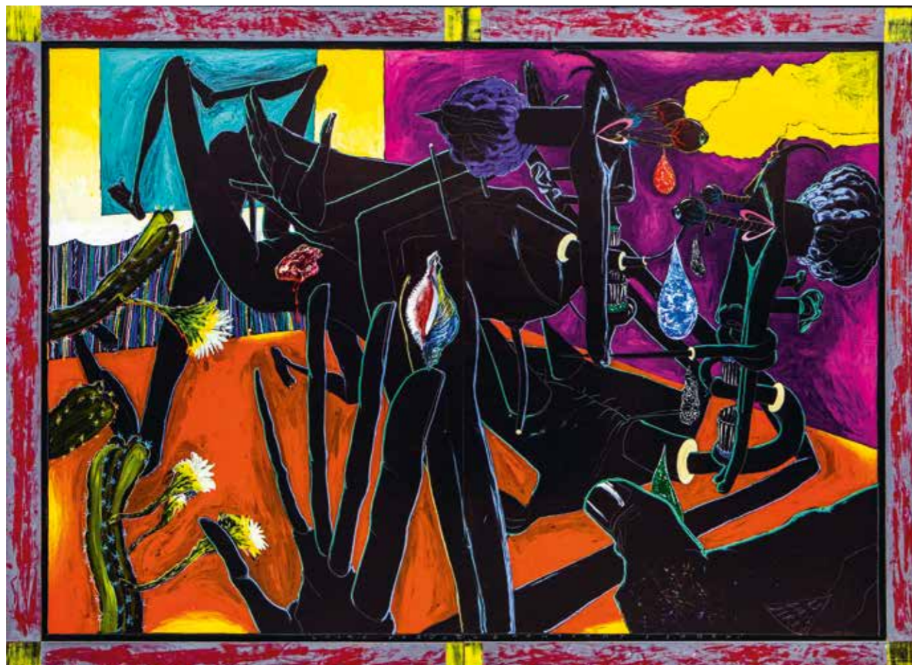
LÁSKA, NADĚJE - DRAHOKAMY I KAMENÍ, 2015, kombinovaná technika na dřevě, 228x370cm

Goya. Jeho excelence vešla, v obleku. Já už jsem měl igelity na zemi a na stole, abych prostor nepotřísnil od barev. V montérkách jsem se na něj podíval, a on říkal, vy jste chtěl jiný oděv a obrátil se. Pak vešel v kardinálském, byl velmi ukázněný, ani se nepohnul, a když jsem požádal, aby se podíval chvíli na mne, neotočil hlavu a jen se podíval. Byl první, kdo to udělal bez pohybu. Řekl jsem, že máme něco společného. Zvedl tázavě obočí. Já jsem řekl, že on deset let myl okna a já jsem dělal sedm let uklízečku na základní škole. Obraz byl pro něj dar od přátel.