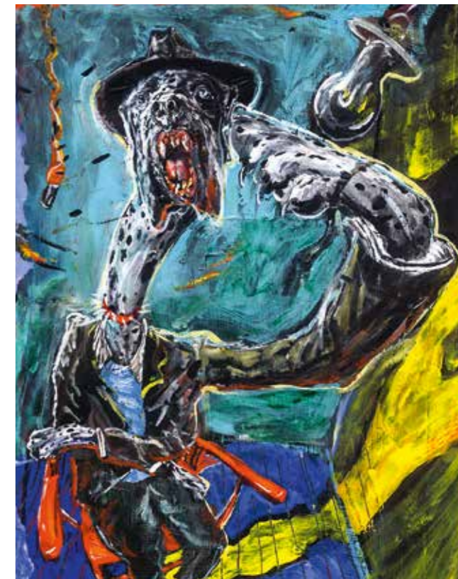
GEORGE ORWELL, ZVÍŘECÍ STATEK, LEDA, 2021, Praha