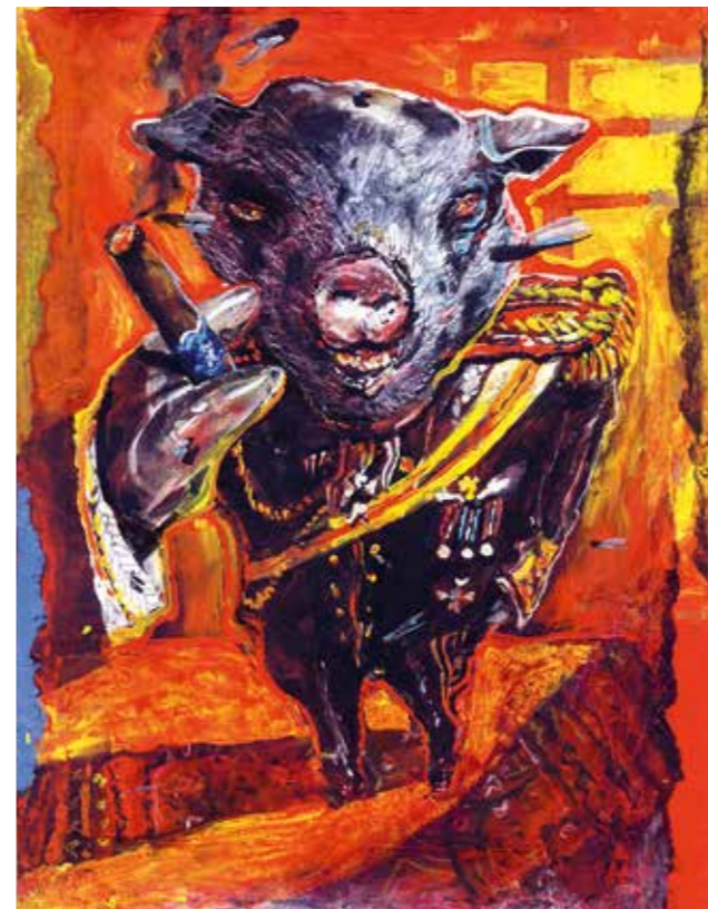
GEORGE ORWELL, ZVÍŘECÍ STATEK, LEDA, 2021, Praha