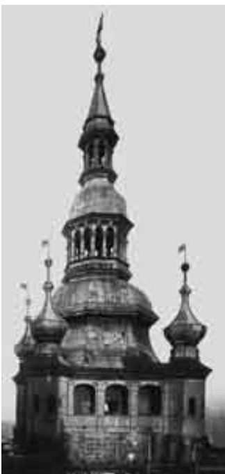
Horní partie jižní věže chrámu sv. Víta