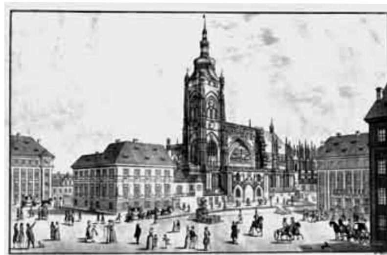
III. náměstí Pražského hradu s nedostavěným chrámem sv. Víta