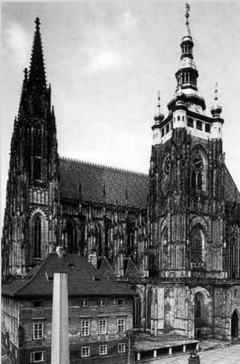
Věže chrámu sv. Víta na Pražském hradě