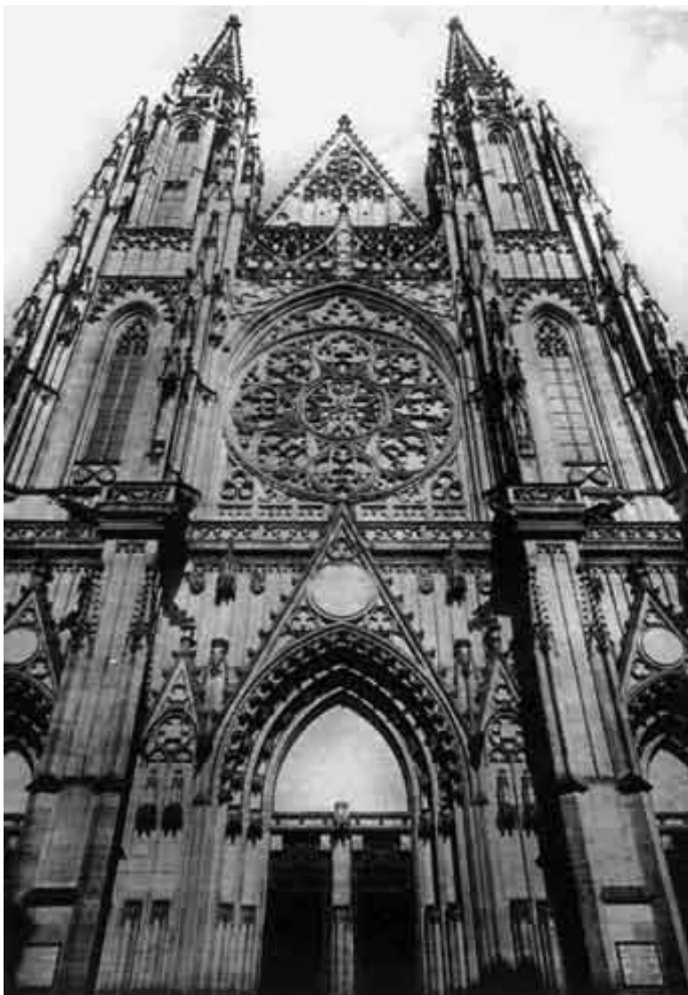
Věže v západním průčelí chrámu sv. Víta

jichž znaky byly na původním vřetenovém schodišti uvnitř místnosti, se nazývá kaple Hasenburská. Schodiště i klenba kaple jsou dnes nové. Velké okno na jižní straně, stejně jako okno do přístavku v jihozápadním opěrném pilíři, obnovil arch. Josef Mocker podle původního parlérovského návrhu, který se dochoval ve vídeňských archivech.